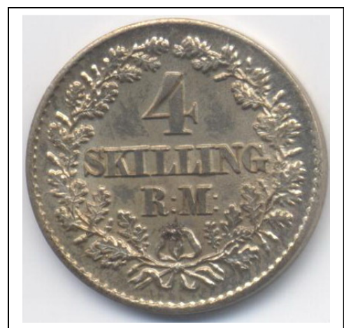
Beide Abbildungen 300 %