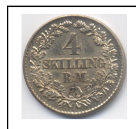
Alle drei Abbildungen 100 %