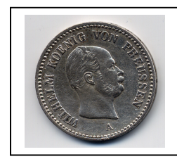
Alle drei Abbildungen 100 %