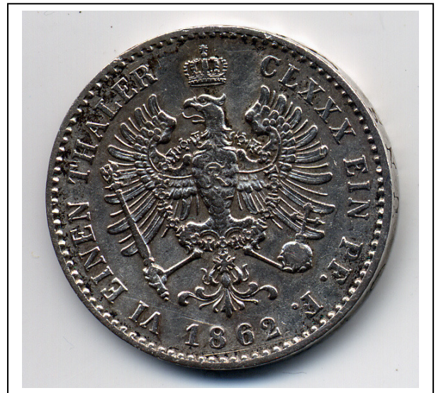
Beide Abbildungen 300 %